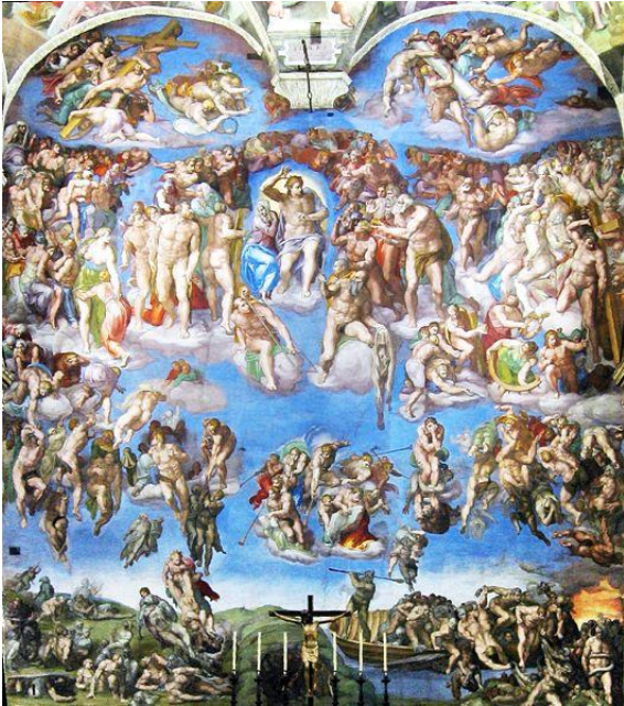
Fig. 2 Il Giudizio Universale