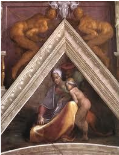
Fig. 3.5. Particolare delle vele