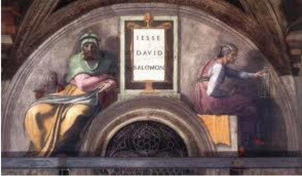
Fig. 3.5. Particolare delle vele